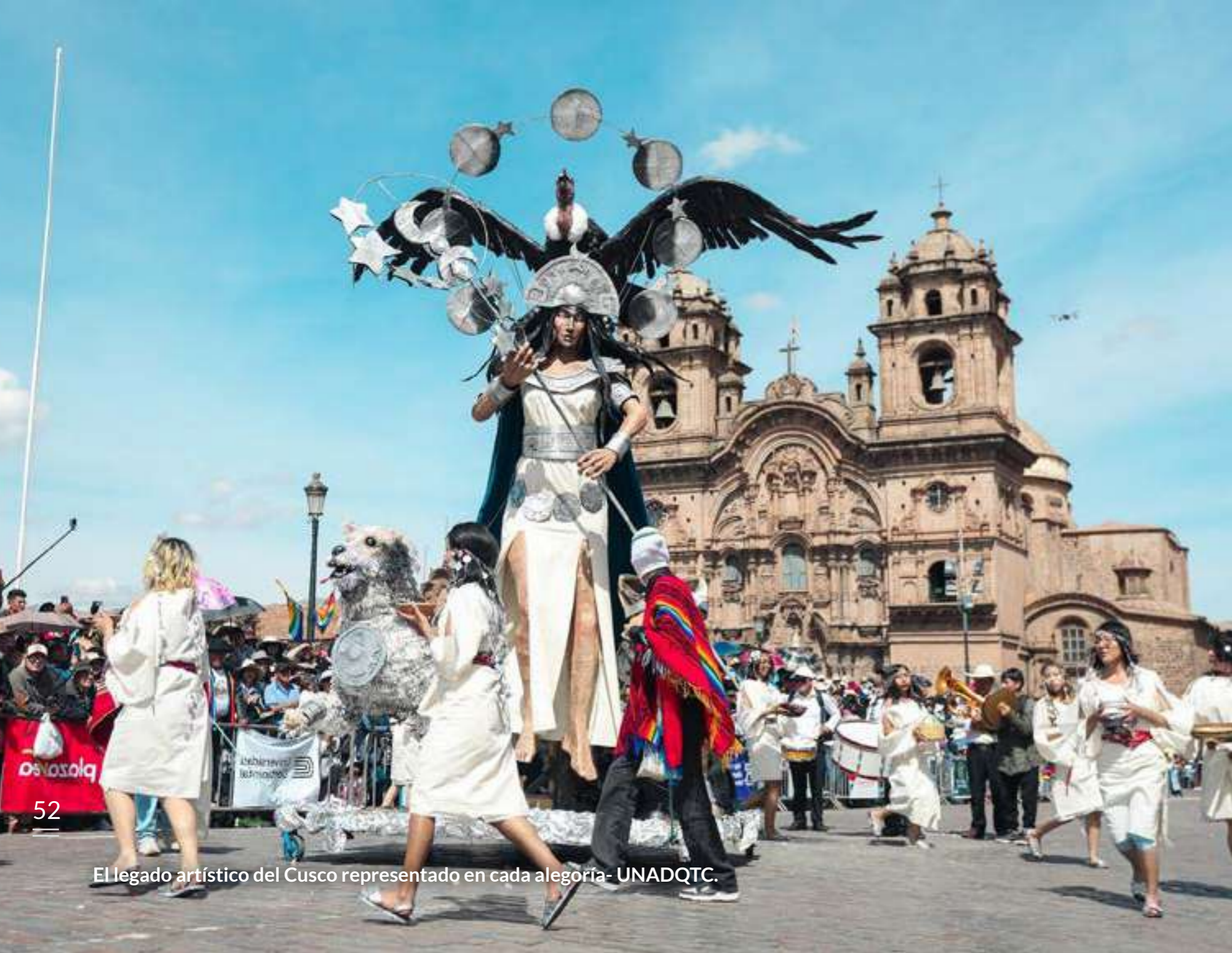
El legado artístico del Cusco representado en cada alegoría- UNADQTC.