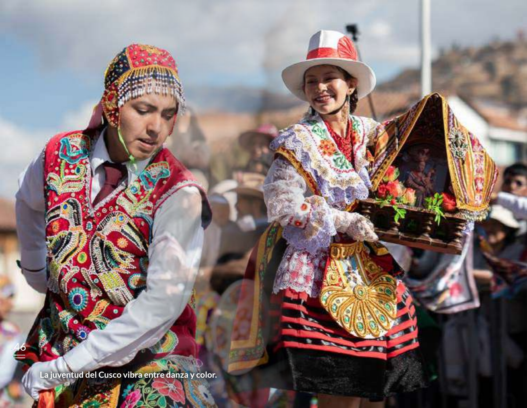
La juventud del Cusco vibra entre danza y color.