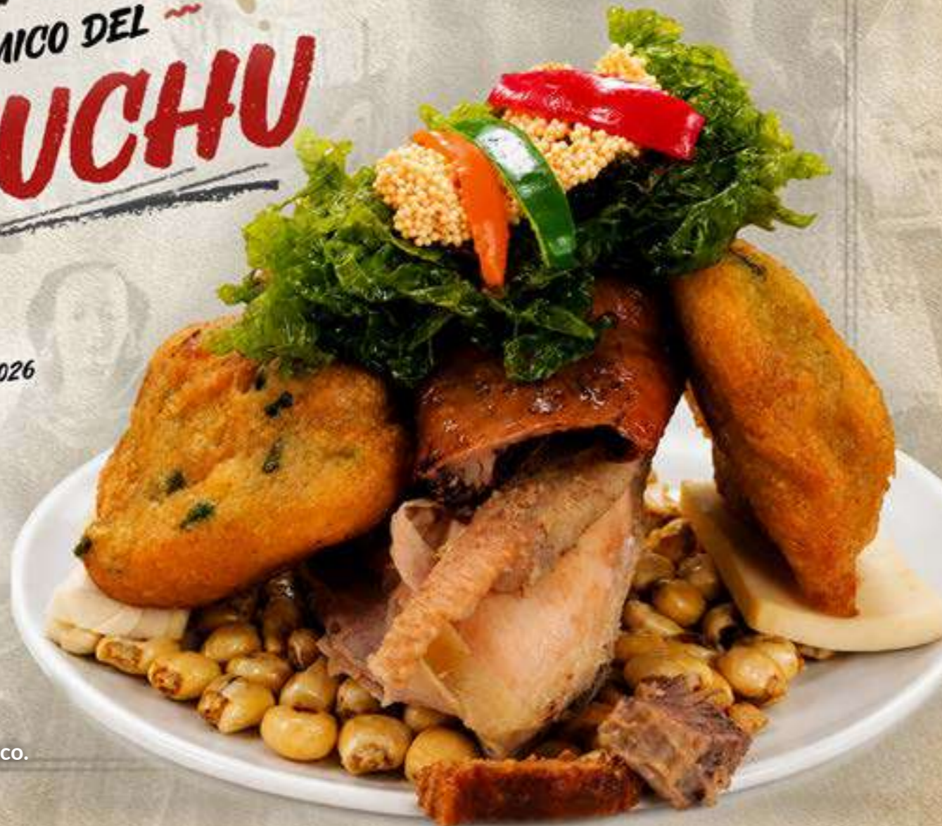
Plato bandera de las fiestas del Cusco.